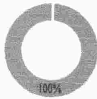
Cumplimiento Gestión EPP